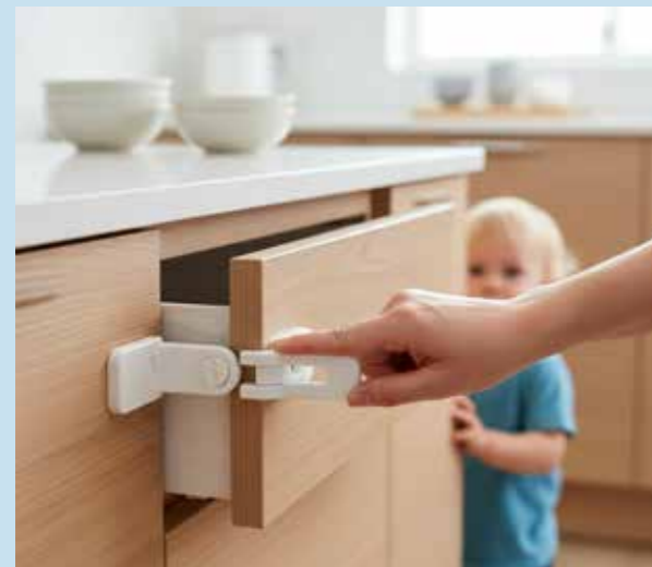
Kein Herausfallen der Gegenstände mehr

Diese Lösungen fügen sich unauffällig in die Küche ein. Sie sehen nichts davon – aber Sie und Ihre Kinder profitieren jeden Tag davon.