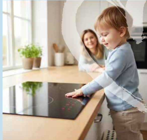
Kein Verbrennen der Hände mehr

Viele moderne Geräte schützen von sich aus: Induktionskochfelder werden nur warm, wenn ein Topf draufsteht – und schalten sich automatisch ab und Backöfen mit Mehrfachverglasung bleiben selbst nach langem Betrieb an der Tür kühl.